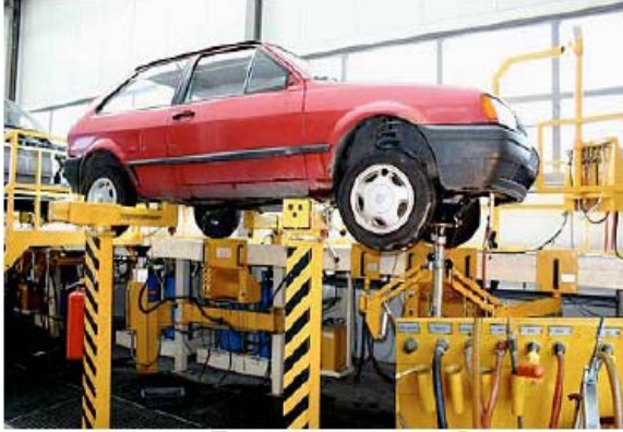
سحب الشحوم والسوائل من أجزاء السيارة