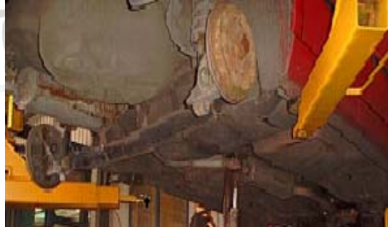
فك الأجزاء المصنعة من المطاط والبلاستيك والزجاج