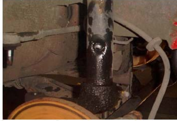
شفط الزيت من المساعدين