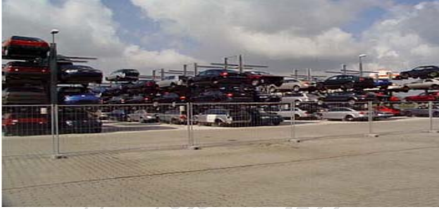
استلام السيارات القديمة وتسجيلها بالدفاتر الخاصة بالسيارات المخردة