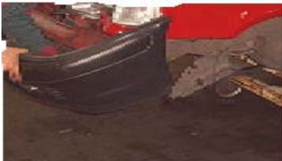
شفط الزيوت والشحوم من أجزاء السيارات